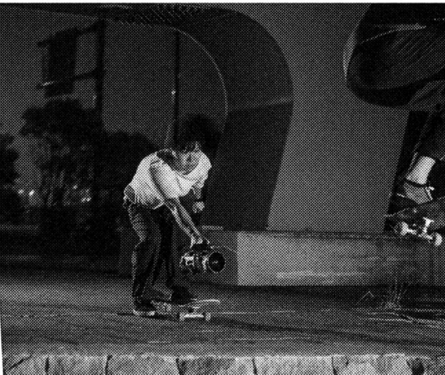
▲こだわりのカメラはソニーVX2000。